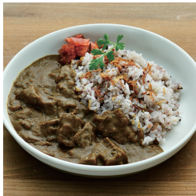
マタギの鹿肉スパイスカレー (北海道産蝦夷鹿使用) Venison curry rice

高たんぱく低カロリーで栄養価の高い蝦夷鹿を北海道のマタギからいただき、様々なスパイスと共にじっくりコトコト煮込みました。