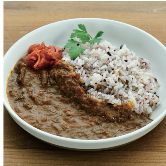
豆野菜カレー (ヴィーガンフリー | グルテンフリー | 無添加) Bean and vegetable curry rice (Vegan-free, gluten-free, additive-free)

ひよこ豆とハト麦の食感が活かしたトマトベースの香り引き立つスパイシーな味わいです。肉類、小麦粉、化学調味料を一切使用していません。