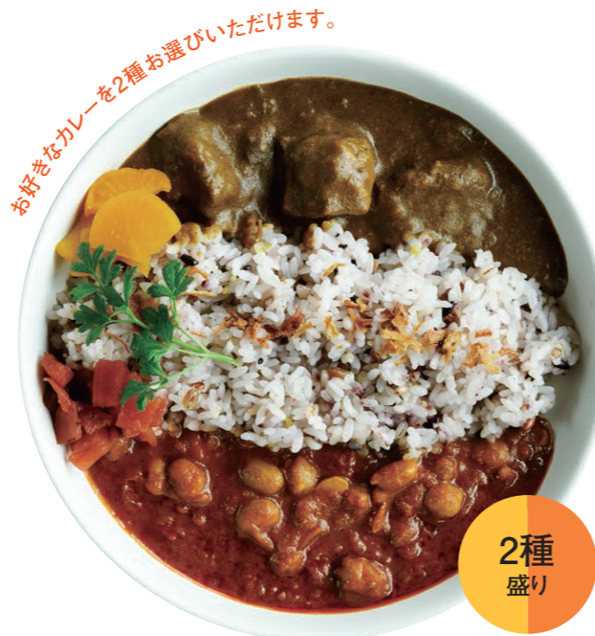
あいがけカレー Two types of curry rice