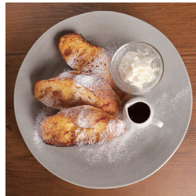
メープル&バター Maple and butter

厚切りバケットでリッチな味わい。軽やかなホイップバターと、たっぷりメープルシロップで仕上げました。