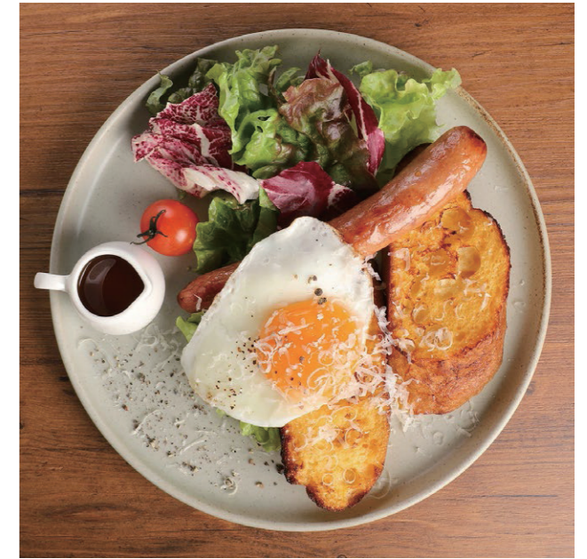
エッグ&ソーセージ Egg and sausage

パリッとジューシーなソーセージと、とろーりたまごのお食事系フレンチトーストです。新鮮なお野菜と共に、ご堪能ください。